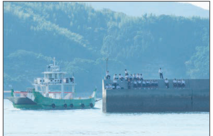
裏面(ビジュアル面)