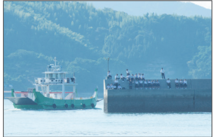
裏面(ビジュアル面)